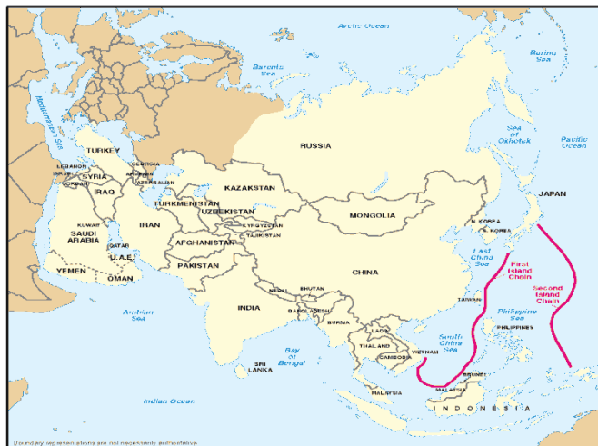
図2 中国の第1、第2列島線

です。南シナ海の方でも、中国がいずれ防空識別圏もやるだろう。2010年から10年間で第2列島線。その次の2020年から40年に太平洋・インド洋の米海軍の独占的支配を阻止しよう。現実にこのような方向で進んでいるという状況があります。