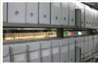
伊方原発行政訴訟資料